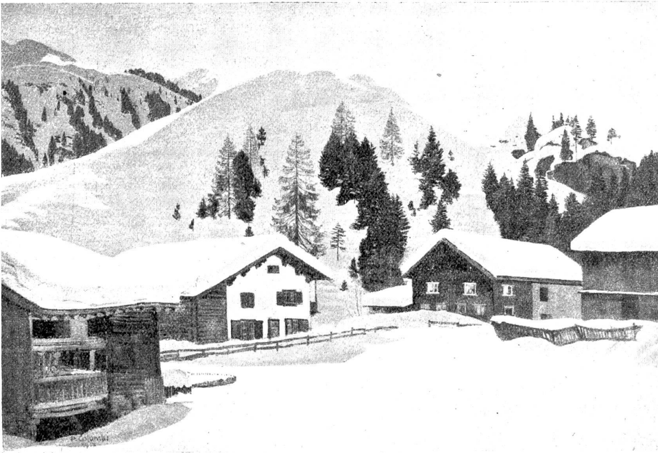
Plinio Colombi: Winterlandschaft in der Gegend von Klosters.

Drucke einer Kraft, deren Dasein und Wesen geahnt, aber nimmermehr begriffen werden kann.“