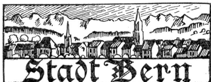
† Julius Bezolt, gewesener Fürsprecher in Bern.

Die fremden Refraktäre und Deserteure im Kanton Bern, die allmählich auf 1500 Personen angewachsen sind, unterstehen den Kontrollen der Regierungstatthalter. Eine Liste wird zurzeit angefertigt, aber die Zählung ist noch nicht abgeschlossen, und es ist wohl möglich, daß die Zahl 1500 weit überschritten wird, da täglich neue hinzukommen. Die Refraktäre und Deserteure können sich bei uns nicht so frei bewegen, wie man allgem. annimmt. Sie haben sich beim Polizeiposten des Ortes zu melden und dürfen ohne Erlaubnis des Regierungstatthalters ihren Wohnsitz nicht ändern. Des fernern haben sie eine Kautions von Fr. 1160 zu hinterlegen. —