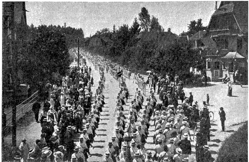
Vom Mittelländischen Turnfest in Ostermündigen — Festzug. (Text siehe Seite 263.)

Von den von den Schweizerischen Bundesbahnen bestellten neuen Güterwagen werden demnächst 100 dem Verkehr übergeben werden.