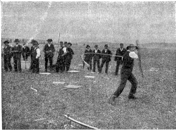
Wetthornusset in Chun 14. Mai 1916. (Joh. Frits, Zäziwil, beim Schlagen.)

Eine große und eindrucksvolle Friedenskundgebung wurde letzte Woche im Berner Münster veranstaltet, zu der