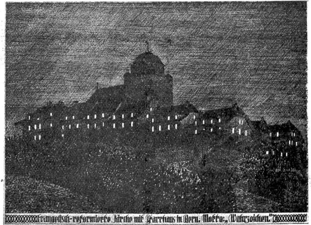
Veielhubelkirche — Nachtbild aus Osten. (Entw. v. Arch. K. Indermühle.)