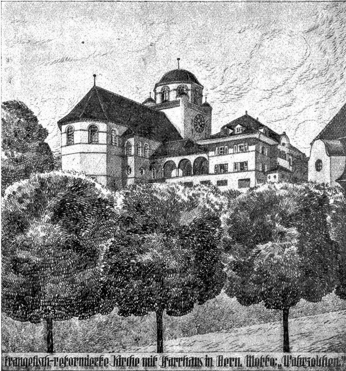
Blick auf den Veielihubel mit Kirche und Pfarrhaus, von Süden. (Entwurf von Architekt K. Indermühle, Bern)

Diesen bedeutungsvollen Namen wird die Mattenhofkirche erhalten. Zur Erlangung von Plänen für den projektierten Kirchenbau war unter den im Kanton Bern nieder-