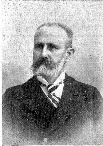
† Ed. Brunner-Wnh.

Am 23. Dezember verstarb nach schwerer Krankheit im Alter von 71 Jahren