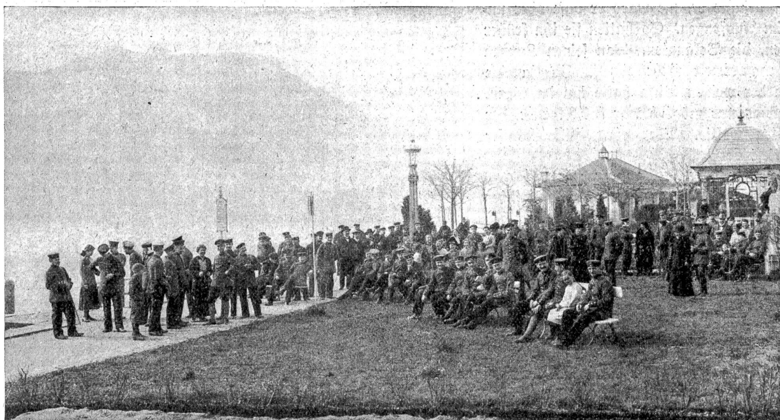
Deutsche Internierte in Weggis (Vierwaldstättersee).

(Klischee aus: Dr. Nagel, Liebeswerke der Schweiz im Weltkriege, Frobenius N.-G., Basel.)