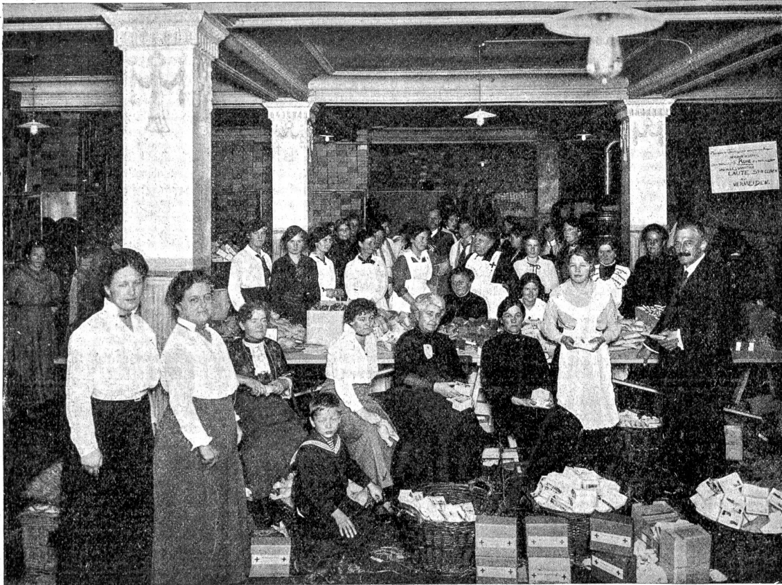
„Pro Captivis“, Hilfsstelle für Kriegsgefangene in Bern, Abteilung des schweizerischen Roten Kreuzes.

drang wurde so groß, daß dem rasch angewachsenen Werke die ursprünglichen Räumlichkeiten sowohl, als auch die alte Organisation nicht mehr genügten. Es wurde unter das eidgenössische Rote Kreuz gestellt, der Armeearzt betraute es mit Spezialaufgaben und die Bundesbehörden zollten ihm ihre offizielle Anerkennung.