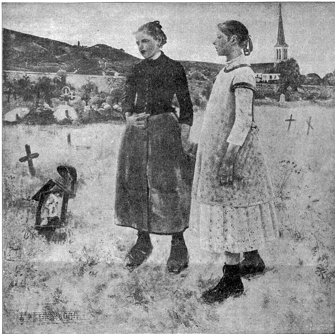
Gustav Jeanneret: Auf dem Friedhof. — Zum Allerseelentag.

Ueber den unerwarteten Vergleich schien Lydia förmlich zu erschrecken, obwohl sie ihre Begleiterin nichts merken ließ. Prüfend fragte sie: