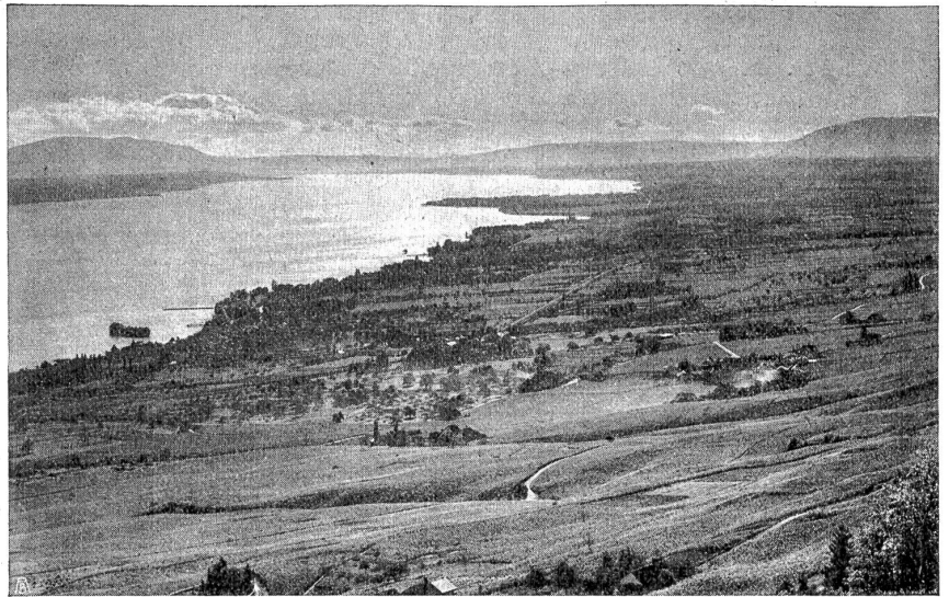
Der Genfersee in seiner natürlichen Aferentwicklung.

den oder Vettern unterstützt war, hielt sich am Ende allen Widerhaden und Stacheln eines fremden Gesetzes zum Trotz und errang sich seinen Platz an der Sonne bürgerlicher Ehrbarkeit und Achtung.