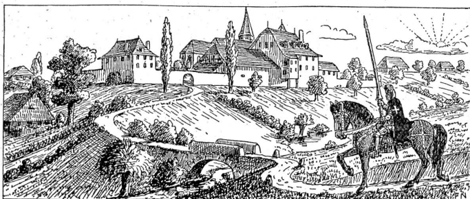
Das Kloster zu Münchenbuchsee.

Originalzeichnung von Dr. S. Ruzbaum. („Erzählungen aus d. heimatl. Geschichte.“)