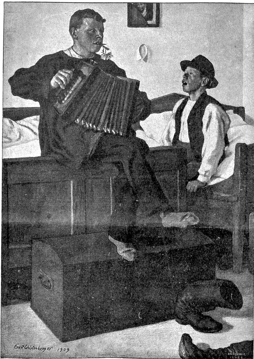
E. Württemberg: In der Knechtekammer.

„So „enorm reich“ wird sie wohl nicht sein, aber ein wunderbares Haus hat sie schon und das allein wäre