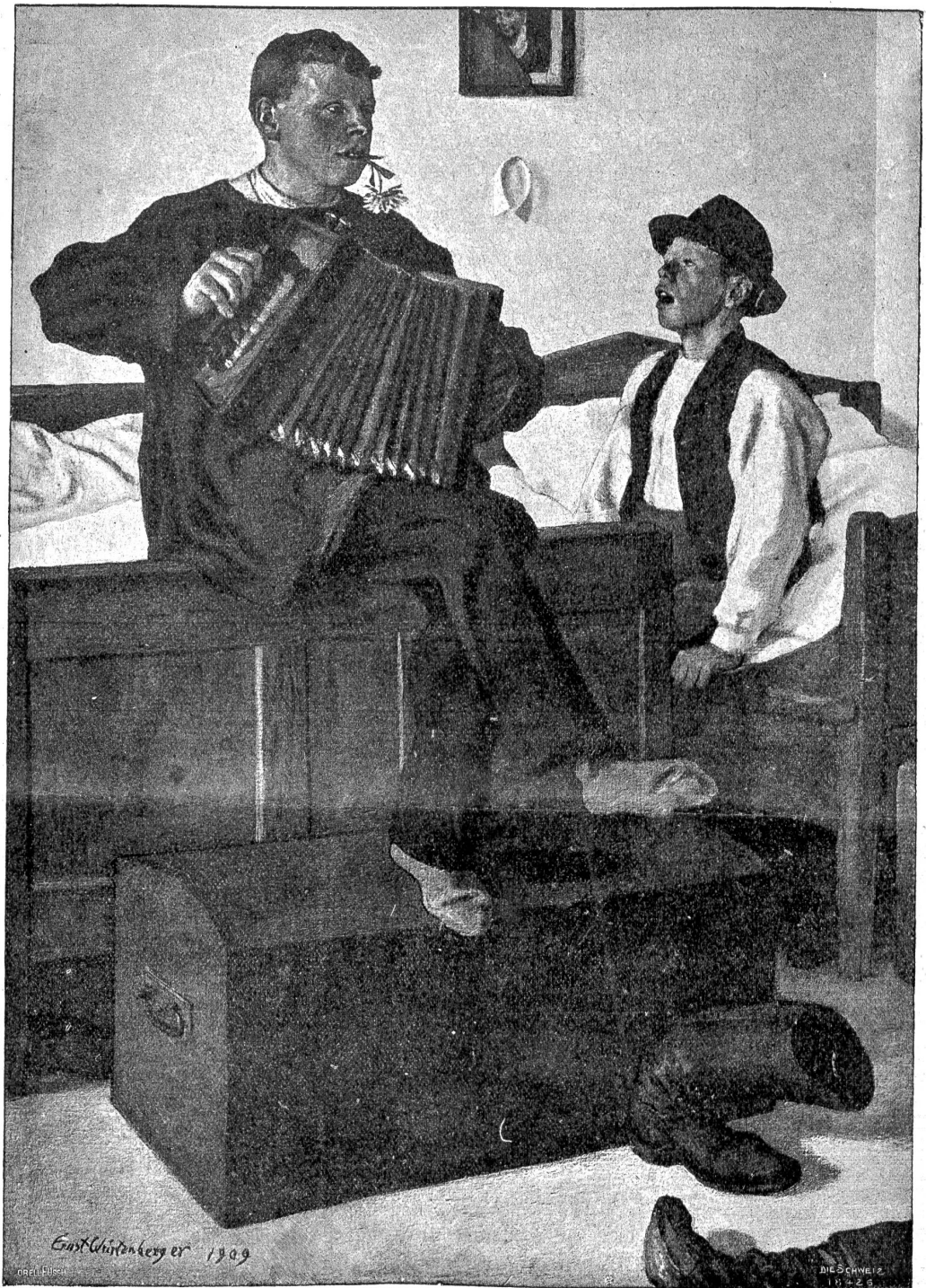
E. Württemberg: In der Knechtekammer.

„So „enorm reich“ wird sie wohl nicht sein, aber ein wunderbares Haus hat sie schon und das allein wäre