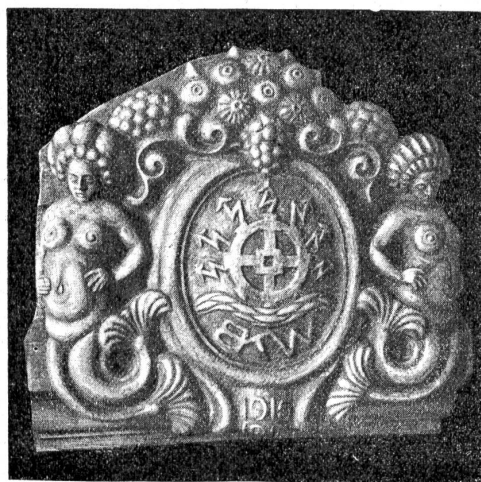
Hauswappen über dem Haupteingang. (Bildhauer Albert Grupp, Biel.)

Bei der Grundsteinlegung des Baues am 20. Dezember 1915 wurde eine Urkunde in das Fundament eingemauert, die eine kurze Geschichte der Entwicklung des Unter-