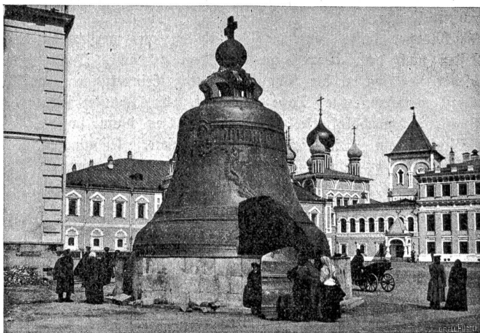
Die Zaringlocke, 1735 unter der Zarin Anna gegossen, 8 Meter hoch, 20 Meter umfassend, über 2000 Doppelzentner schwer, ist aber nie geläutet worden, sondern liegt auf offenem Platze mit ausgebrochenem Stück auf ihrem Steinsockel.

Besonders bezeichnend für die Staatsfeindlichkeit und radikale Art der russischen Intelligenz ist jene halb philosophisch, halb religiös begründete, politisch tätige Sekte des Nihilismus, die, was Weltanschauung betrifft, trostloser als der Buddhismus ist und deshalb auch die radikale Vernichtung aller gegenwärtigen politischen und gesellschaftlichen Verhältnisse verlangt. Mit der Einführung der Konstitution