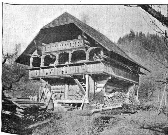
Speicher in Rüegsau, 1749.

Unter dem großen Strohdach war ursprünglich alles ein großer, ungeteilter Raum, mitten unter dem Dachbalken der Feuerherd, als Sammelplatz der Familie, und nahe dabei an den Wänden die Lagerstätten für die Nacht, der übrige Raum diente teils als Stallung für Roß und Rind und