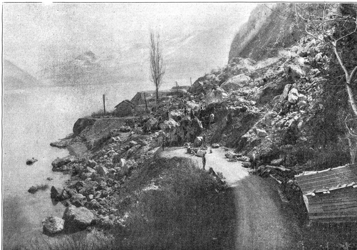
Der Bergrutsch zwischen Saulensee und Leissigen am Thunersee.

In Anbetracht der gegenwärtigen Lage hat das Armeekommando die Aufhebung folgender 14 Preßkontrollbureaux vom 1. Mai abhin verfügt: Lausanne, Neuenburg, Freiburg, Bern, Biel, Aarau, Solothurn, Luzern, Zürich, Win-