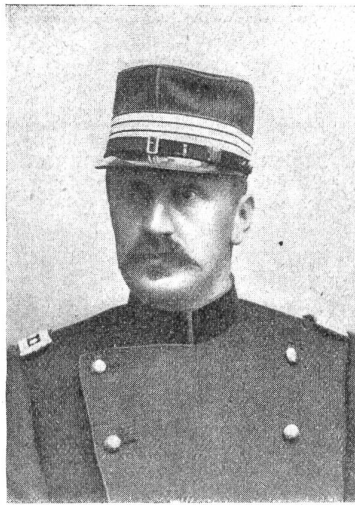
† Oberst Robert Keppler.

ße lagen, samt den Pferden eine steile Halde hinunterstürzte. Wohl wurde Blatter und ein Mitfahrender abgescleudert, aber er kam heil davon und auch von den Pferden wurde nur eines leicht verletzt. —