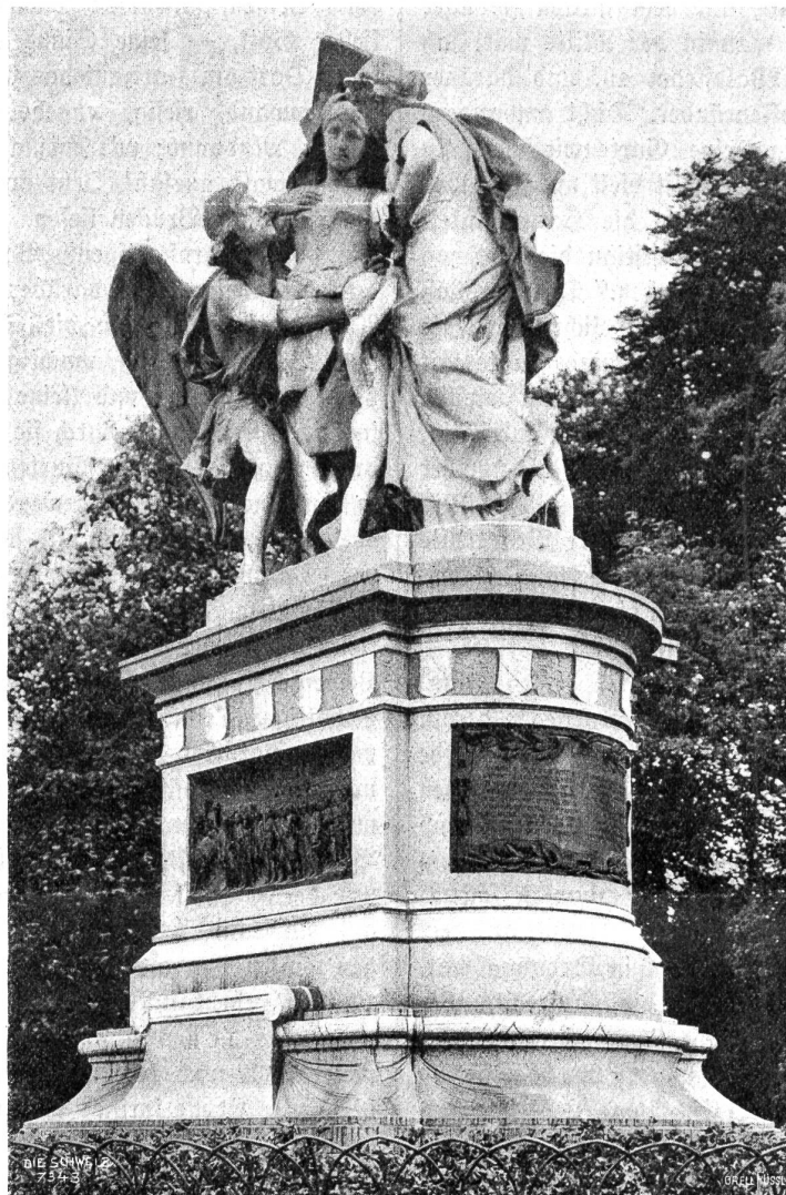
Das Strassburger Denkmal in Basel, von Aug. Friedr. Bartholdi.

Zivilbevölkerung Straßburgs Erleichterungen zu bewirken. Sie waren mit Empfehlungsschreiben des schweizerischen Bundesrates und des norddeutschen Gesandten in der Schweiz versehen und darum wurden sie vom General freundlich aufgenommen. Nach einigem Zögern gestattete er der Delegation, die deutsche Linie zu überschreiten und sich in die Stadt zu begeben. Um dies möglich zu machen, befahl er eine kurze Einstellung der Beschießung. Am Sonntag den 11. September ritten die Schweizer zu den französischen Vorposten hinüber, wo sie von einem Adjutanten des Generals Urich erwartet wurden. „Unter französischer Eskorte,“ heißt es im Bericht, „ging es in die Festung hinein. Hinter den Wällen tauchten massenhaft die französischen Soldaten hervor, die gerne die Gelegenheit benützen, wieder einmal ungestraft von den feindlichen Kugeln über die Wälle hinaus ins Land zu sehen; unheimlich starrten einem die messingenen Schlingen in den Schießluken entgegen. Die Fallbrücke ist herunter gelassen, das große Tor öffnet sich: welch unerwartetes Schauspiel bietet sich unsern verwunderten Augen dar! Im Torweg steht dichtgedrängt