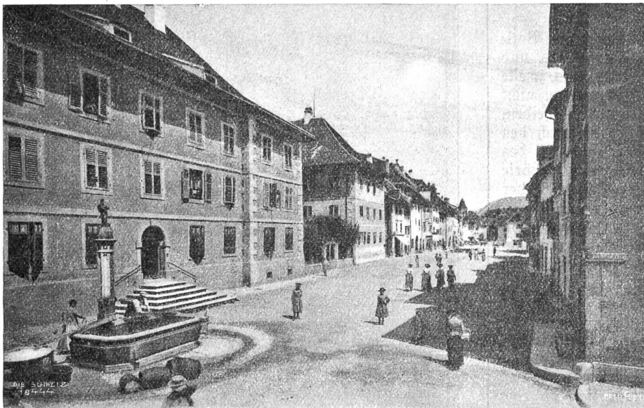
Strassenbild aus Delsberg.