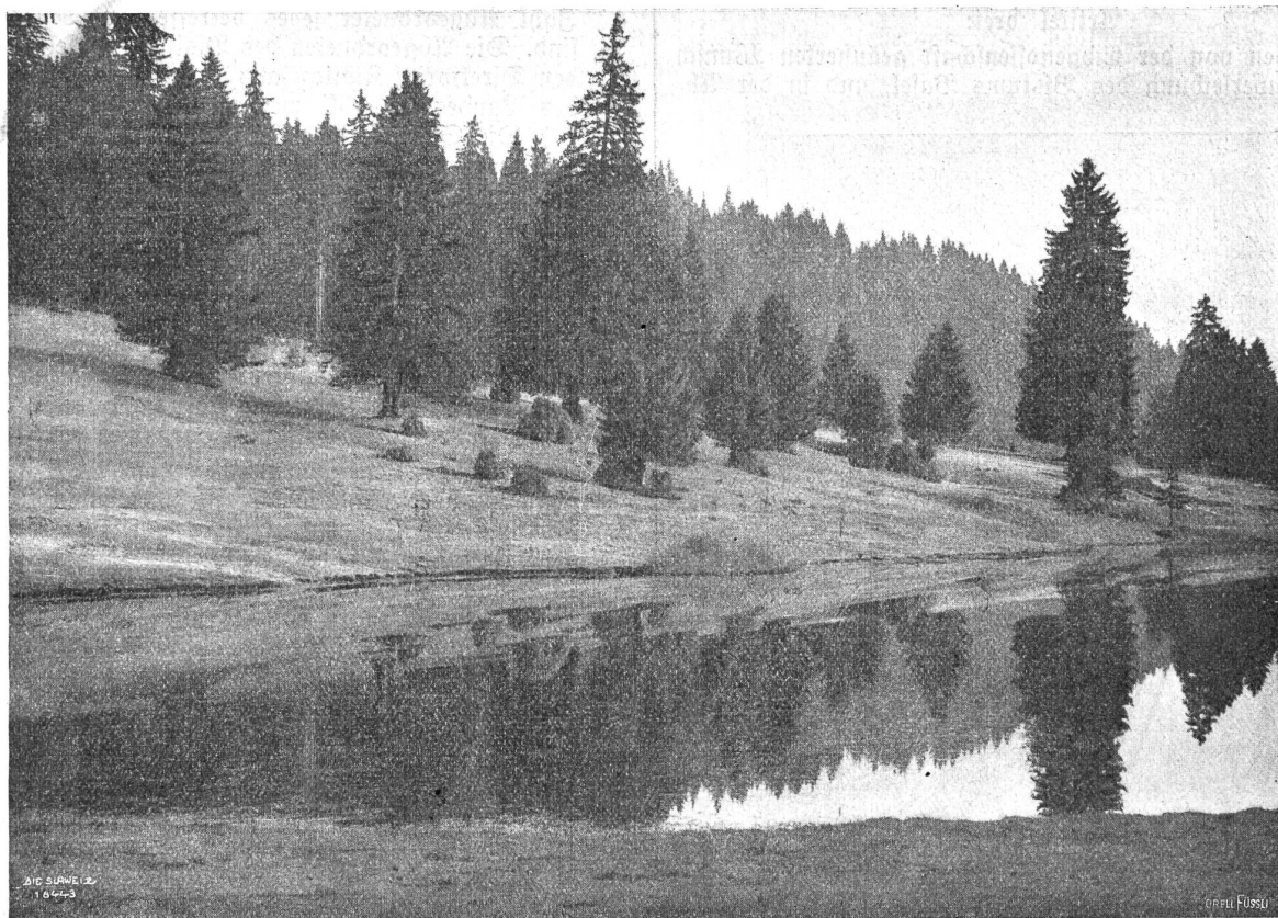
In den Freibergen.

Da machte ich große Augen, stand noch ein Weilchen verblüfft mitten in der Stube; dann verzog ich mich aber blitzgeschwind.