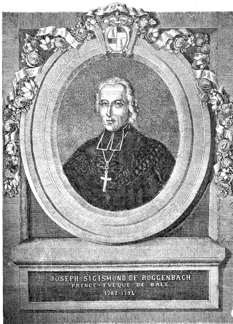
Fürstbischof Joseph Sigismund von Roggenbach.

Es steht in jedem Schweizergeschichtsbuch zu lesen, wie gegen Ende 1797 auch der Schweizerboden von den Franzosen besetzt wurde als Einleitung ihres Ueberfalls gegen die Eidgenossenschaft. Genau so wie Genf, teilte nun das ehemalige Bistum alle Geschicke Frankreichs, alle Vor- und Nachteile französischer Verwaltung bis zum Sturze des napoleonischen Großreiches. Mit dem Jahr 1800 ging