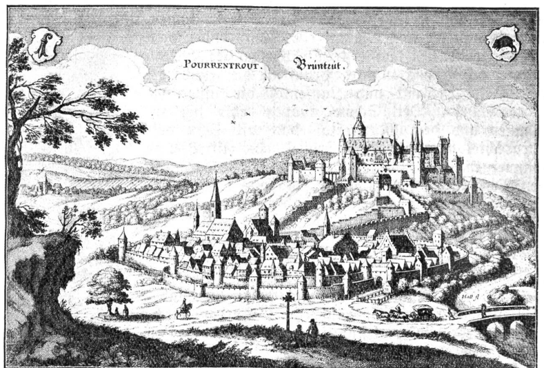
Pruntrut im XVII. Jahrhundert. Nach der „Topographie Alsatia“ von Merian, 1643.

Zweimal bewies der Staat Bern sein politisches Erziehertalent. Das alte Bern nahm die Waadt in die Kur, befreite sie vom savonischen Joch und beglückte sie mit den Kulturfortschritten der Reformation. Das neuere Bern erprobte sein Talent an den Jurassiern. Diese gestehen es selber ein, daß sie in seiner Schule viel gelernt haben und allem Vermuten nach ein glücklicheres Dasein führen, als