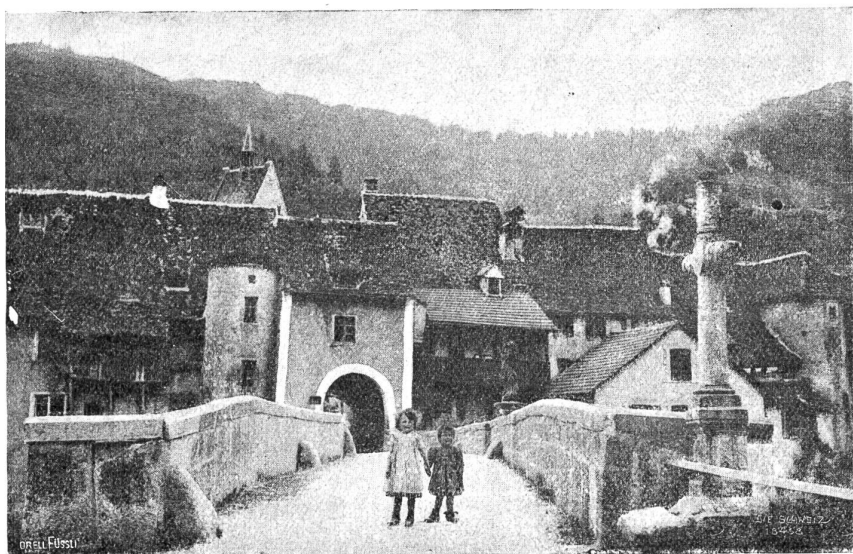
St. Ursanne. Brücke und porte du Clos du Doubs.

Napoleons Militärmoloch schuld. Ihm haben sie immer wieder die Blüte ihrer Jungmannschaft opfern müssen. Gewalttätig wurden die jungen Leute ihren Familien entrissen, nur wenige kamen zu den Eltern wieder zurück. Es gab Dörferchen, wo innert 8–10 Jahren keine Hochzeit mehr gefeiert wurde. Einzelne Jurassier brachten es im Militär zu hohen Graden und waren Napoleon treu ergeben. Die Masse der Bauern aber dachten nur an die Opfer, die für eine Sache fielen, die nicht die ihrige war. Der russische Feldzug hatte sie auch noch einige hundert Tote gekostet.