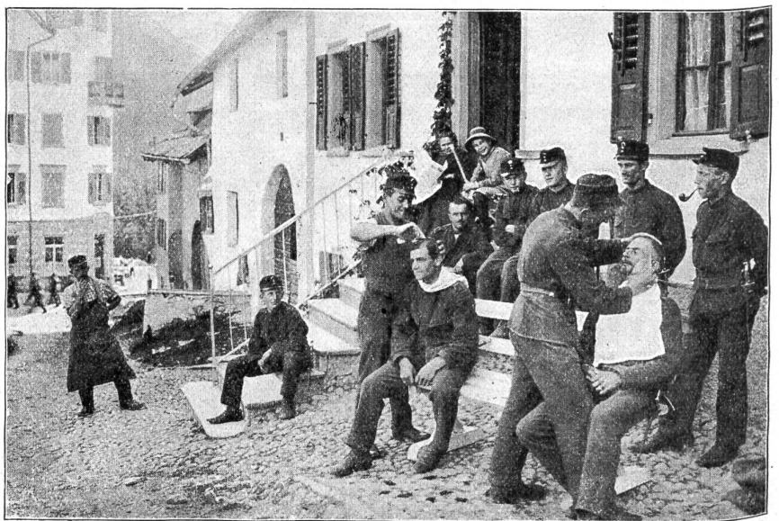
Beim Verschönerungskünstler.

mußten, nun aber mit Böden, Licht und Herd, ja sogar mit hängendem Grün und Bilderschmuck ein ganz trauliches Ansehen gewonnen haben. Und dann gilt's, die Stube ebenso sauber zu erhalten. Sauber in mehr als einer Beziehung. „Versteht die wohl auch Spässe?“ fragte zuerst zweifelnd der eine oder andere, auf die Leiterin deutend, die sich keineswegs immer durch Runzeln und graue Haare von vornherein als Muetterli ausweist. „Freilich!“ lacht dieses freundlich, „aber nur die guten Spässe versteh ich.“ So blieb es denn bei den guten. — „Sie ersparen uns Disziplinarfälle, diese Stuben, mehr vielleicht als man so denkt,“ sagte mir ein Oberst, der es nicht verschmähte, auch einmal am sauberen Brettertisch Kaffee und Apfel-