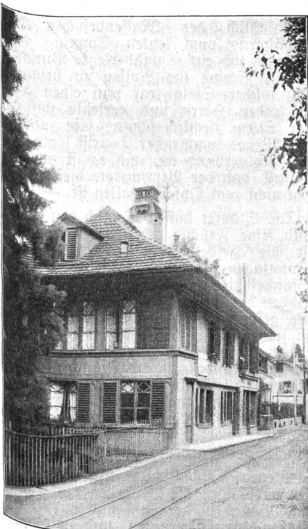
Das Brahmsſchloſſe in Thun.

Vom 1. Juli weg wurde die Fleiſchratſion der Truppen an der Grenze von täglich 300 Gramm auf täglich 200 Gramm herabgeſetzt. —