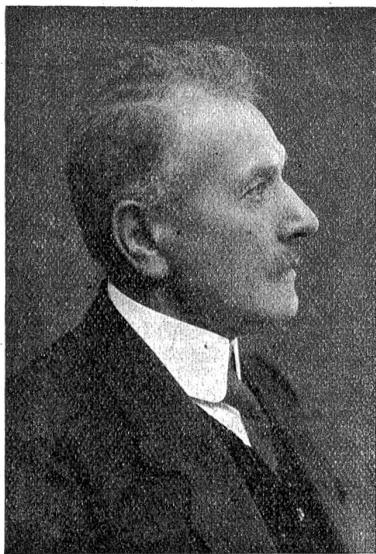
Nationalrat M. Bühler, Präsident des Preßkomitees.