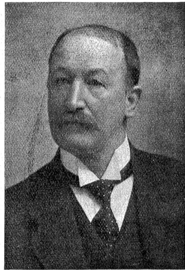
Regierungsrat Tschumi, Präsident des Publizitätskomitees.

Arbeiten der Aussteller, die in 57 Gruppen geteilt und von Gruppenkomitees mit ca. 800 Mitgliedern beraten, sich die Art und Weise ihrer Schauausstellung zu überlegen hatten.