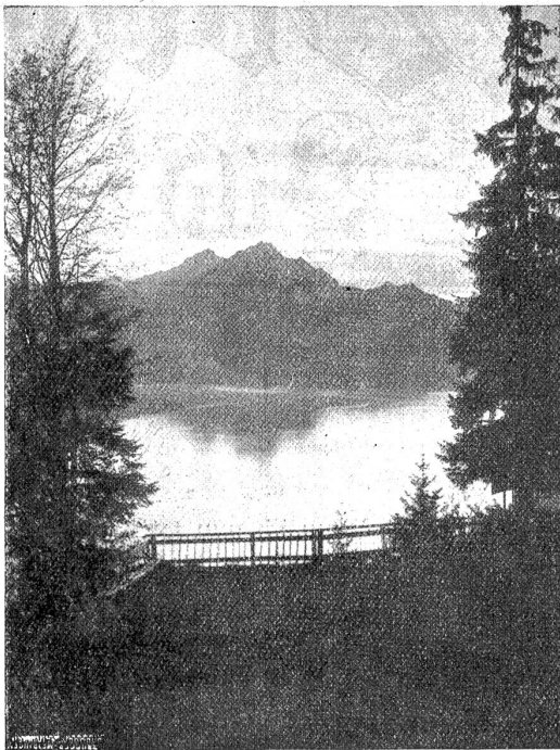
Sonnenuntergang. (Ausblick beim Kurort Rigi-Seejantor.)

ganz gewiß sei's nur Spaß; es würde sie immer freuen, wenn ich käme, doch das Täten solle mir nicht zugemutet werden. Als sie endlich zu Ende war, versicherte ich sie