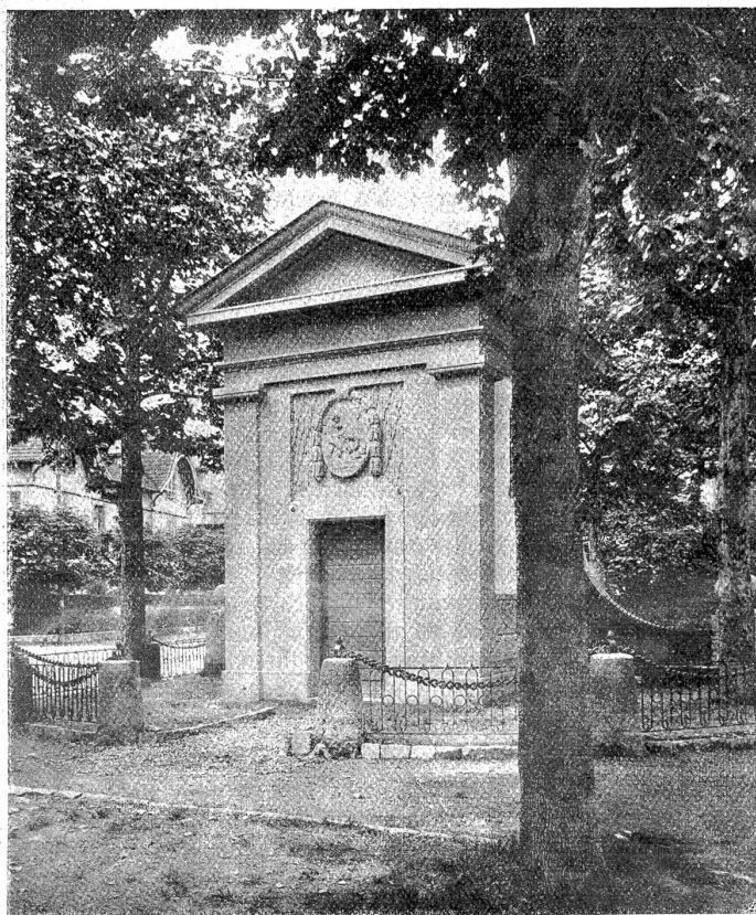
Transformatorenhäuschen an der Zieglerstrasse.

Als man im November 1911 zum Abbruche der alten Münze schritt, an deren Stelle der Neubau des nun fertigen Bellevue Palace-Hotel zu stehen kommen sollte, kam dem Hauptportale gegenüber der imposante Monumentalbrunnen zutage, dessen Schicksal nun auch besiegelt war. Ganz vom roten, wilden Reblaub überwachsen, von dem stimmungsvollen Säulenhofe im Empirestil umgeben, bot dieser Brunnen einen prächtigen Anblick. Der in Hast betriebene Abbruch der Münze bedrohte ihn mit Untergang. Da nahm sich Architekturmaler A. Tiede seiner an. Nach seinem Vorschlage und unter seiner Leitung wurde der Brunnen sorgfältig abgebrochen, um an der Kreuzung der Schwarztor- und der Zieglerstraße im Januar und Februar 1912 wieder aufgebaut zu werden. Der Brunnen war früher an eine Wand angelehnt, und nun mußte irgend eine Gestaltung der Rückseite gefunden werden, die ähnlich wie die Fontaine Medicis im Luxemburgpark zu Paris, gegen eine Allee schöner Bäume gerichtet war. Zwei Pilaster sollten dort eine an die Wand