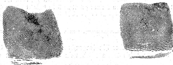
4. Zusammengesetzte Muster.

Wie vorauszusehen, hat der Kriminelle sofort, da man begann die Daktyloskopie anzuwenden, eine auf Täuschung hinielende Erfindung gemacht. In Schweden zu allererst begannen Einbrecher mit Gummihandschuhen, die Zeichnungen von Papillarlinien trugen, zu operieren. Auch Gummihülsen kamen auf. Diese Maßnahmen haben in der Kriminalistik keine große Bedeutung. Denn erfahrungsgemäß werden die meisten Delikte ohne lange Vorbereitung begangen.