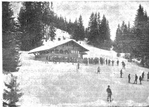
Saamenmöser Skihütte. Skiklub Bern.

anhaben. Schlimmer ist's am Morgen mit dem Aufstehen, der Uebergang vom warmen Pfühl in die eisige Luft fordert unerhörte Ueberwindung; gottlob ist das Wasser gefroren, so daß uns wenigstens eine unangenehme Prozedur erspart bleibt.