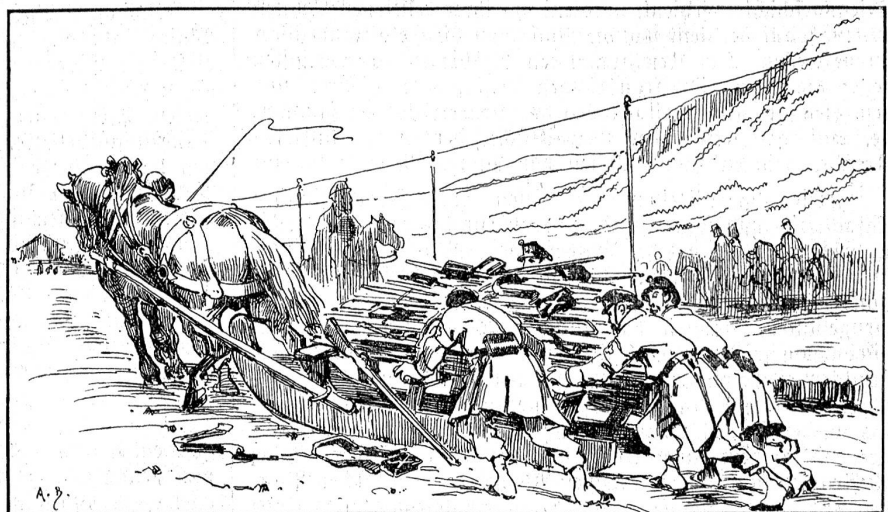
Von der Grenzbesetzung 1870/71: Transport der Gewehre der französischen Ostarmee.

Wegrande zwei Lanzen eingesteckt, auf der einen der Helm eines französischen Curassiers, auf der andern eine preußische