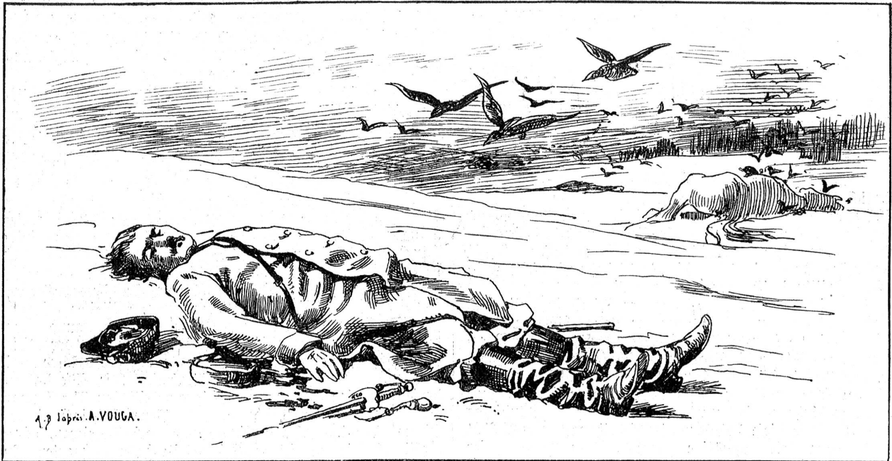
Von der Grenzbesetzung 1870/71: Nach der Schlacht (toter französischer Offizier).

bevor sie die Latzhäue und Stride, welche sie jetzt im Tode noch festhalten, gestossen hatten bis auf den Stumpf im Boden, und den Stumpfen am Maul.“