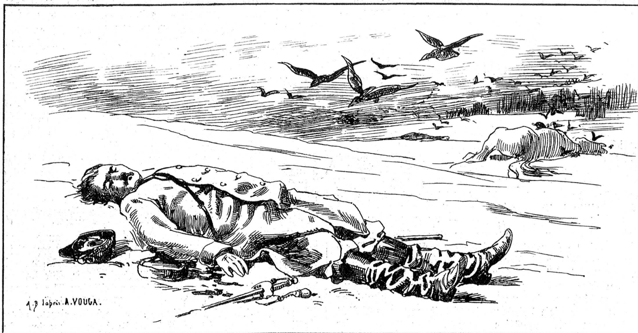
Von der Grenzbesetzung 1870/71: Nach der Schlacht (toter französischer Offizier).

bevor sie die Latzhäue und Stride, welche sie jetzt im Tode noch festhalten, gefressen hatten bis auf den Stumpf im Boden, und den Stumpfen am Maul.“