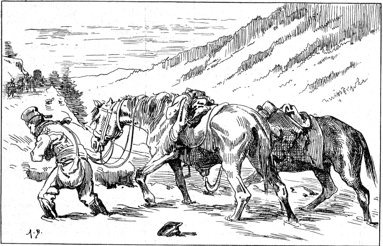
Von der Grenzbesetzung 1870/71: Französische Kavallerie im Schnee.

Widelhaube. Das sollte sagen: hier ist neutrales Land. Beidseitig zogen sich der Straße entlang vier flasterhohe Gewehrbeigen. Haufen von Patrontaschen, Trommeln, Signalhörnern, Kürassen, Lederzeug und anderen Ausrüstungsgegenständen wie Säbel, Lanzen, Revolver und Munition lagen daneben. Etwas strahabseits lagen in Haufen die den Franzosen abgenommenen Fleischstücke, frisches Rindfleisch, das hier zu Grunde ging, da es nun liegen blieb und schlecht wurde. Die Verpflegung der französischen Truppen, wenigstens des Teiles, der bei St. Croix übertrat, stand gewiß nicht schlecht. Schlimmer war es mit der Verpflegung der armen Pferde bestellt.