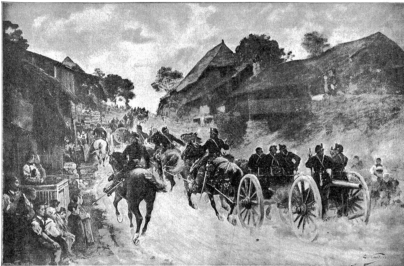
Von der Grenzbesetzung 1870/71: Fahrende Batterie auf dem Marsche durch ein Dorf.

verkauft und verfolgte getragen, wahrscheinlich weil sie annahmen, die Schweizer werden schon für neue sorgen.“