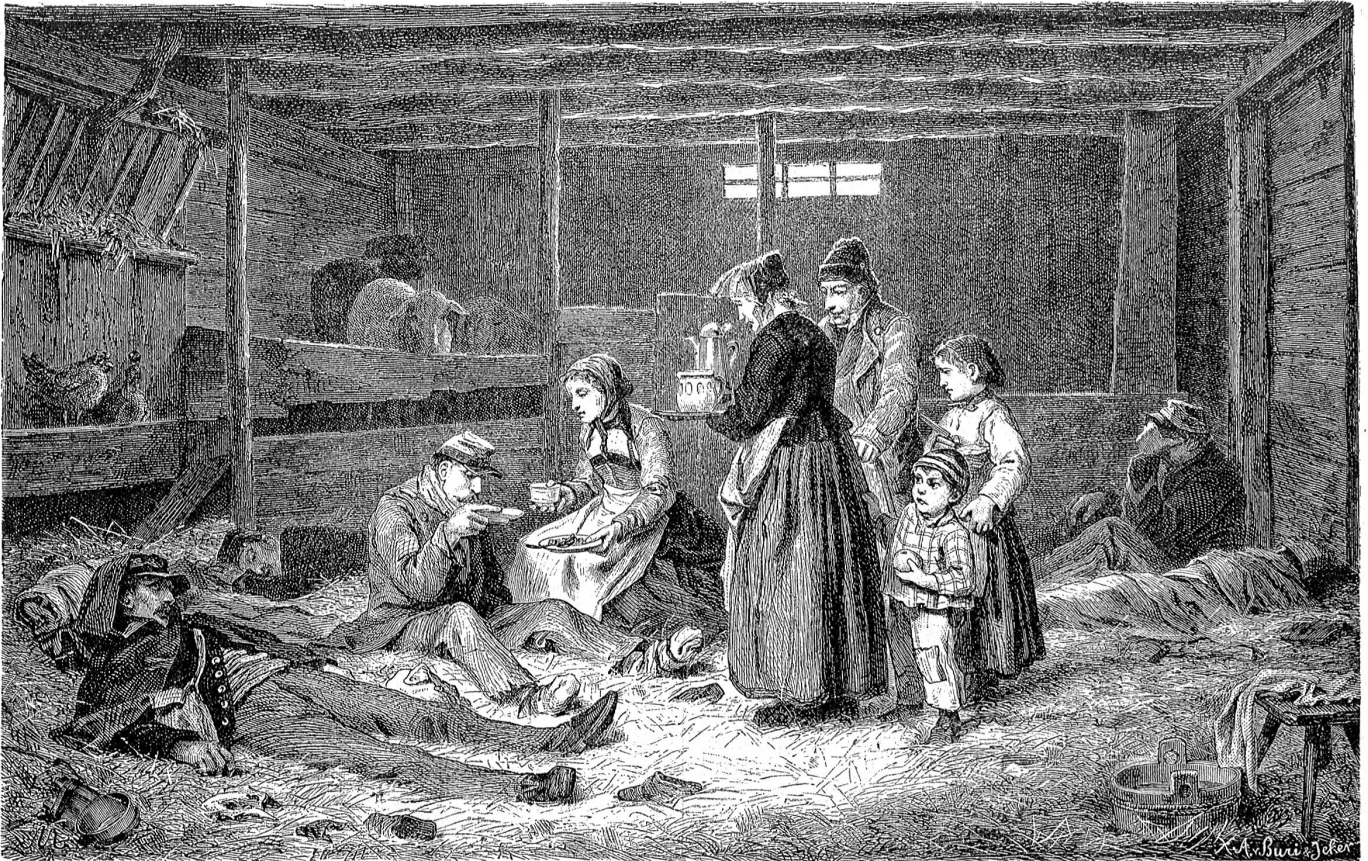
Von der Grenzbesetzung 1870/71: Bernische Landleute, Bourbaki-Soldaten verpflegend.

(Nach seinem Oelgemälde auf Holz gezeichnet von A. Anker.)