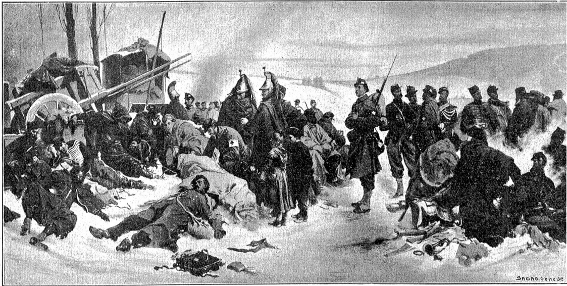
Von der Grenzbesetzung 1870/71: Die Bourbaki-Armee in Verrières.

rot und weiß gewürfelten Teppich. Er schlug die Beine übereinander und sah die Wirtin erwartungsvoll an.