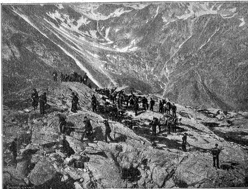
Bilder aus der ſchweizeriſchen Armee: Gebirgsartillerie im Marchgebiet des Simplon.