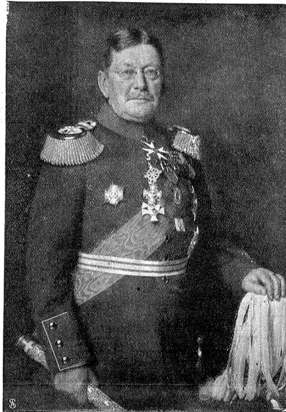
Feldmarschall Frhr. von der Goltz, deutscher Gouverneur von Belgien.

in eine einzige Festung verwandelt. Ein siegreiches Oesterreich wird mit seiner künftigen Balkanpolitik über die Interessen des „gewesenen“ Bundesfreundes zur Tagesordnung schreiten. Die italienische