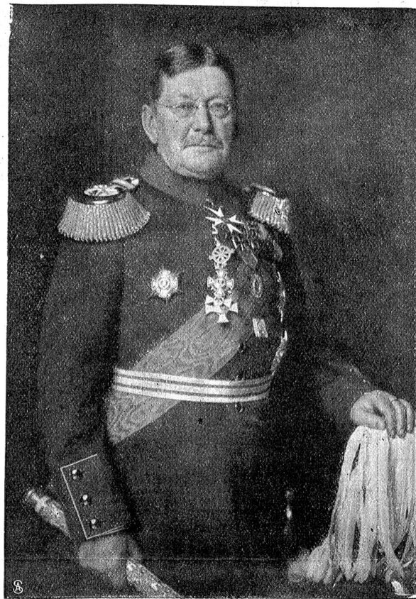
Seldmarschall Frhr. von der Goltz, deutscher Gouverneur von Belgien.

in eine einzige Festung verwandelt. Ein siegreiches Oesterreich wird mit seiner künftigen Balkanpolitik über die Interessen des „gewesenen“ Bundesfreundes zur Tagesordnung schreiten. Die italienische