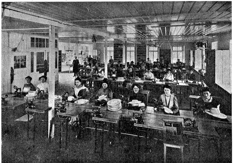
Bilder aus der Strohhutfabrikation: Nähsaal der Firma H.-G. J. J. Sijchers Söhne in Dottikon.

Kehren wir zu den wunderbaren Runtgebilden aus Rohhaar und Strohcordonnets zurück, die schon 1896 in Genf hohes und berechtigtes Aufsehen erregten, und die heute sozusagen aus dem Handel fast vollständig verschwunden sind. Gleich im ersten Fenster des achteckigen Pavillons sehen wir eine sorgfältig getroffene Auswahl mustergültiger