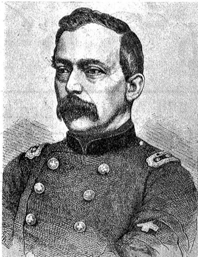
General Hans Herzog (Grenzbesetzung 1870).

Wenn sie mit ihrem Knaben allein war, so erzählte sie ihm vom Werden und Wachsen seines Vaters, von der