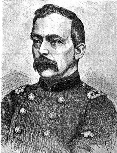
General Hans Herzog (Grenzbesetzung 1870).

Wenn sie mit ihrem Knaben allein war, so erzählte sie ihm vom Werden und Wachsen seines Vaters, von der