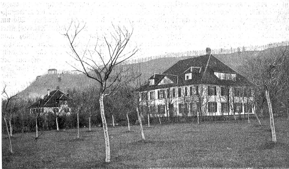
Der Neu Hof bei Birr (im Hintergrund das Schloß Brunnegg.)

Betriebskapital aufbessern helfen. Jeder Schweizer wird gerne die Gelegenheit ergreifen, durch Ankauf der Bundesfeierkarten dem gemeinnützigen Unternehmen seine Sympathie auszudrücken.