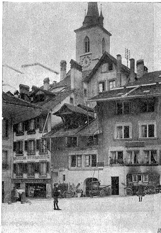
Das alte „Burgerhus“, das älteste Rathaus von Bern, überragt vom Turm der Nydeckkirche.

Aber der Bauer zog aus, als ginge es durch fremdes Land und hatte doch einst manchen Blick noch übrig für die Sachen am Weg, auf Flur und Wiesen.