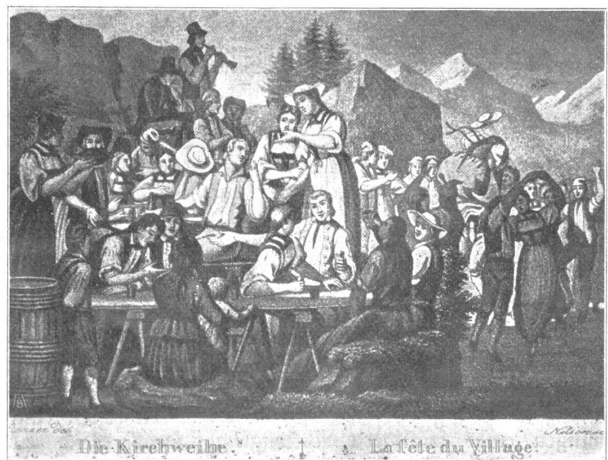
Die Kirchweih. La fête du village.

wie ihn aber kaum die Wirklichkeit je bot. Doch um ein photographisches Wiederbild des Tatsächlichen bekümmerte sich Vogel so wenig wie je sich ein echter Künstler darum annahm; so ist sein Bild — trotz vieler Einzelzüge und einer fast unfaßbaren Menge von Gruppen und Figuren — nicht zur anekdotischen Erzählung geworden, sondern zu einer packenden, echt künstlerischen Darstellung schweizerischen Wesens und heimischer Festfreude. Das Steinstoßen ging, auf den Nelspler-Festen, gewöhnlich dem Schwingen und Ringen voraus; in Unspunnen gab es auch ein Schützenfest, anderorts nahm man im Laufen und Springen Wettspiele auf. Vielfach wurde und wird heute noch bei Kirchweihfesten in den Bergen auch ein Schwingervettkampf veranstaltet; an Stelle des Steinstoßens tritt dann meist das Kegeln, wobei oft die Kugel geworfen, nicht geschoben wird. Der ländliche Tanz nach ländlichen Weisen und aufgespielt mit heimischen Instrumenten, fehlt heute noch so wenig wie um die erste Hälfte des letzten Jahrhunderts. Doch allzu sicher ist uns dieser Besitz an echtem Volkstum nicht mehr! Wie sich die Surrogate in Speise und Trank, in Kunst und Literatur bis in die abgelegensten Täler den Weg gebahnt haben, so zerlegen sie auch auf andern Gebieten das Volkstum. Das Grammophon läßt auf