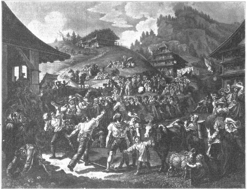
Steinstosserfest auf der Rigi Nach einem Gemälde von Ludwig Vogel, gestochen von S. Hegi.

Eine historische Reminiscenz an die alten Hirtenfeste muß mit dem Hinweis auf die heutigen Aelplerstage geschlossen werden. Wir sind in einer Zeit, wo sich urwüchsiges Kraft mit geübter und überlegter Könnerschaft mißt, wo der Aelpler in die Dörfer und Städte heruntersinkt, um mit dem Turner zu ringen, und wo der zähe und doch gewandte Bergler noch oft genug den trainierten, fehnigen Sportsmann aus der Stadt obenhin auf den Rücken wirft. Jedes Jahr finden solche Aelplerfeste, Kanonale oder schweizerische, statt, oft mit großartigen Viehsummen (wie diesen Sommer in Eschholzmatte), und es ist nur zu wünschen, daß solchen Veranstaltungen nicht weniger Interesse entgegengebracht wird, als vielleicht sensationellern Sportsdarbietungen, denen aber keinesfalls die gleiche volkstümliche Bedeutung zukommt. An Spannung, an interessanten Stellungen und an Posen, die jeder Plastiker als wahre Kunstleistungen bezeichnet, sind die Aelplerfeste mit ihrem Steinstoßen und dem Schwingen sicher reich genug! — Ihnen schließen sich die Hornußerfeste an, welche die Spieler eines echt schweizerischen Rasenspiels jeweils vereinigen; hier kommt weniger ein Aelplerbrauch zur Geltung als ein Bauernspiel des Mittellandes, das erfreulich große Anhängerschaft hat und in der ganzen Schweiz gepflegt wird.