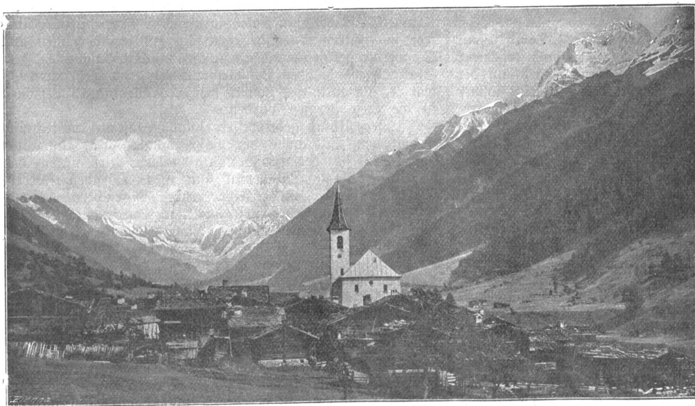
Löttschbergbahn: Kippel im Löttschental mit Biettschhorn.

sich in Bewegung. Ein Pfiff — Dunkel empfängt uns, wir sind im Tunnel. — Was bietet diese Tunnelfahrt? Doch wohl