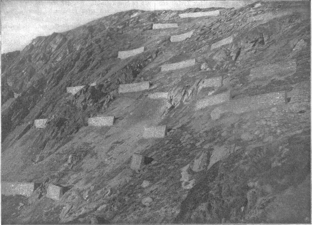
Lötschbergbahn: Die Lawinerverbauungen bei Goppenstein.