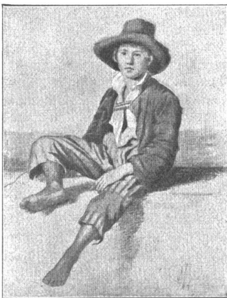
Peter Rosegger — der Waldbauernbub.

Ehre und Ruhm genoß Peter Rosegger mehr als je einem lebenden Dichter vergönnt war. Mit seinem ersten Buch war er berühmt; zwei Universitäten (Heidelberg und Wien) schenkten ihm den Doktorhut, sein Ruhm führte ihn an die Tafel von Königen, sein Name klingt in Millionen Herzen vertraut und lieblich. Seine Popularität ist geradezu einzigartig: Ein armes Bauernbübchen, ein schwächlicher Schneidersohn kommt hinunter in die Stadt und macht so von sich reden, daß alle Welt den Berg hinaufsteigt zu der einsamen Alp, das arm-selige Haus mit seiner rauchgeschwärzten Stube zu sehen, worin der Waldbauernbub geboren wurde. Sein Sommerhaus in Krieglach und sein Haus in Graz sind Wallfahrtsstätten geworden für sensationslüsterne alte und junge Menschenkinder.