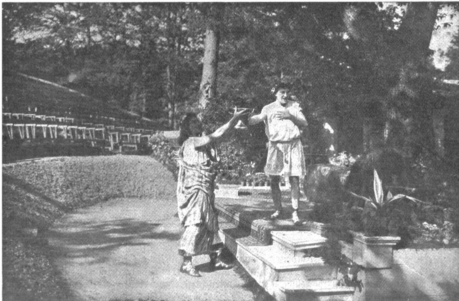
Freilichttheater in Bertenstein. Szene aus des „Meeres und der Liebe Wellen“. — (Text hierzu auf Seite 238.)

Zwei Hosen am Leibe, so wie es damals schon bei jedem ordentlichen Manne der Brauch war. Eine dieser Hosen mußte heute weg. Es konnte nur die innwendige sein, eine hüsch weiße, darf ich sagen, von Leinwand. Da die Gegend ringsum menschenrein war, so tat ich — denn es war ja wieder einmal ich — nicht lang um, riß die Kleider herab und warf die weiße Hose in das Korn, das in seiner Reife weit hingebreitet stand. Dort war sie unsichtbar für etwa Vorübergehende geborgen. Das Uebrige wieder ordentlich angezogen und so auf den Berg.