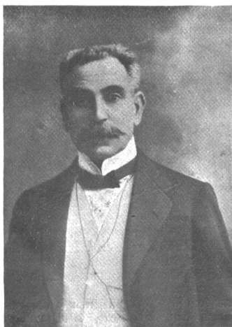
† Giovanni Amendola

Noch ist den meisten Bernern die elegante Erscheinung des Verstorbenen erinnerlich, dessen