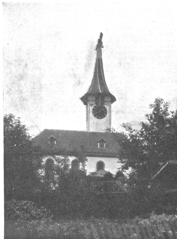
Die Kirche in Wichtrach, nach dem Brande vom 17. Juni 1913.

Nach C. F. L. Lohner war die Kirche von Wichtrach dem heiligen Mauritius geweiht, lag im Dekanat Münstingen des