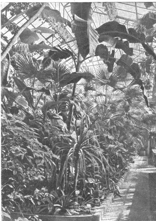
Das Innere des Palmenhauses des botanischen Gartens in Bern.

Ueber dem breiten Fußweg, der diese Ansiedelung von den übrigen Partien des botanischen Gartens trennt, ist noch eine andere kleine Blockgruppe. Nicht alle sind Alpenpflanzen,