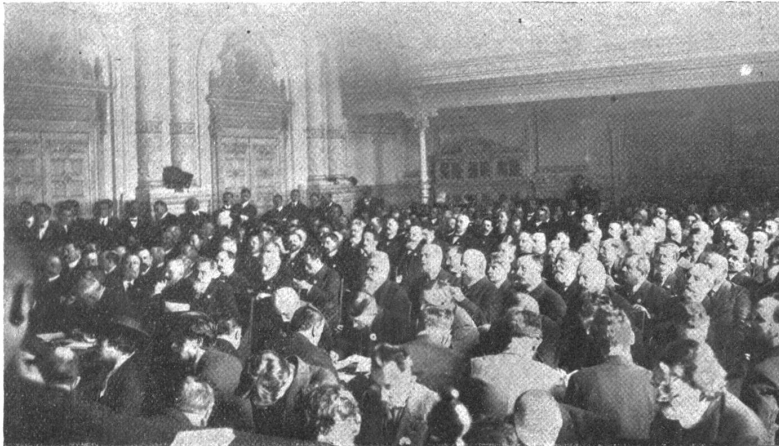
Deutsch=französische Verständigungskonferenz, Pfingsten 1913.

gerichtetes Volkstugenden das Verhängnis der Menschheit. Da trinnen in tausend Bächen die Selbstüberhebung und die Unduldsamkeit hinab in die Geröllhalben der schlimmen und schlimmsten Instinkte. Als verderbenbringender Strom, der alle Schranken der Menschlichkeit niederreißt, — der Krieg ist öfters schon mit dem entfesselten Bergstrom verglichen worden — mit vernichtender Gewalt ergießt sich der nationale Haß hinaus in die blühenden Gefilde, alle Kultur unter Schutt und Trümmern begrabend. Wehe dem Lande, das seine Wildwasser gewähren läßt, das den schützenden Wald, den die Wehre niedergerissen, nicht wieder aufbaut; es wird verwildern; öde Steinwüsten werden wie in der Sage die grünen Weiden und lachenden Wiesen bedecken. Kein, der Mensch bändigt heute auch den wildesten Bergstrom, er bepflanzt das Einzugsgebiet der Wildbäche, damit dort das Erdreich festgehalten werde, in dem das Wasser segenspendend versickert.