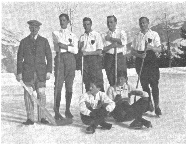
Der Eishockey-Club Bern am Turnier von Leysin um die schweizerische Meisterschaft Serie B

Am Samstag nachmittag ist auf der Station Lugano der Schnellzug Mailand-Basel bei seiner Ausfahrt auf den am Eingang des Massagnotunnels auf die Einfahrt wartenden Güterzug gestoßen. Beide Maschinen wurden aus den Schienen geworfen, mehrere Güterwagen wurden zertrümmert. Der Materialschaden