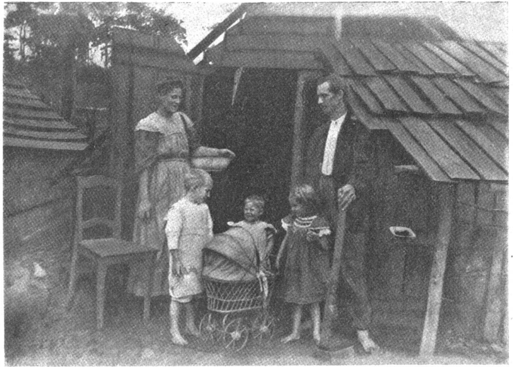
Die erste Unterkunftshütte eines Schweizerkolonisten auf der Kolonie Cenlvalas Junior in Brasilien.