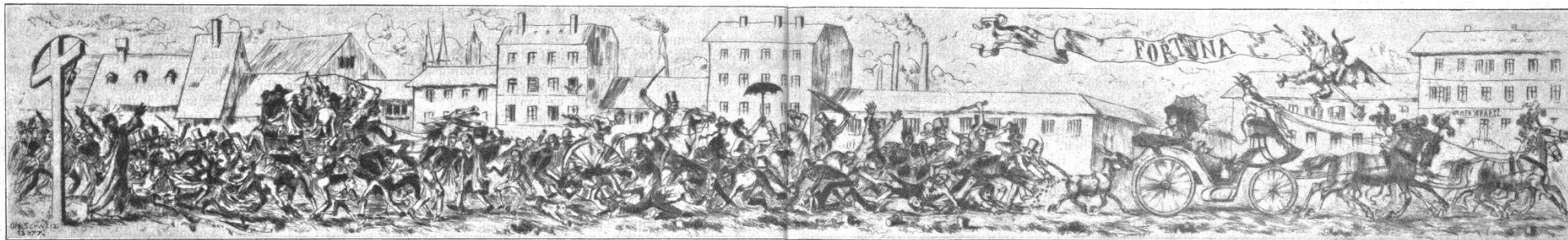
Die Jagd nach dem Glück. Radierung von Albert Welti.

zwar vorübergehend abgelenkt wird, aber doch immer wieder sein Ziel findet und ihn, getrieben von der inneren Notwendigkeit, zustrébt mit einer Sicherheit, die dem Zuschauer fast nachwandlerisch vorkommt. Hier half die vielgerühmte Kultur nicht mit und Wissen und sogenannte Bildung auch nicht; denn Welti war einer der wenigen Glücklichen, die des Schuljades gar nicht bedurften und die die Kultur ruhig entbehren konnten. Nur in vollkommener Freiheit vermochte sich sein Wesen zu entfalten; seine Gaben wiesen ihn auf die Laufbahn des freien Künstlers; etwas andres hätte er gar nicht werden können.