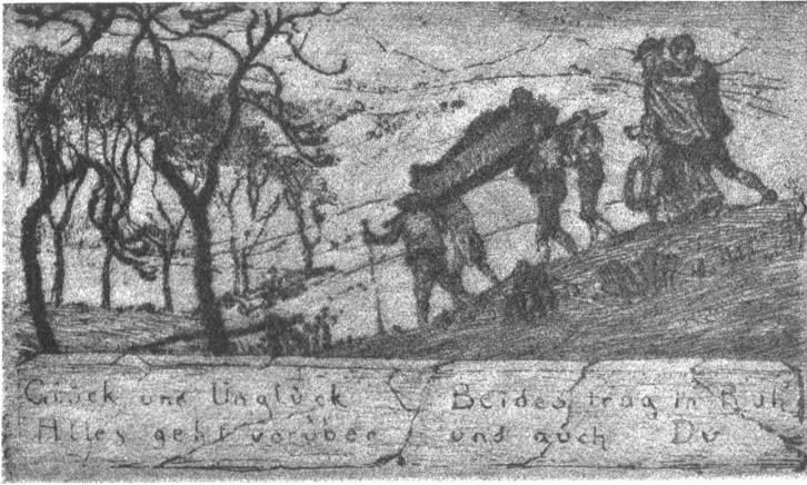
Das Begräbnis. Nach der Radierung von Albert Welti.

Dem Kunstwart bleibt das große Verdienst, durch sein wiederholtes Eintreten für Welti eine stets wachsende Gemeinde auf ihn aufmerksam gemacht zu haben, besonders durch seine Mappe, die eine Auswahl von Gemälden und graphischen Arbeiten des Künstlers in verschiedenen Reproduktionsverfahren brachte.