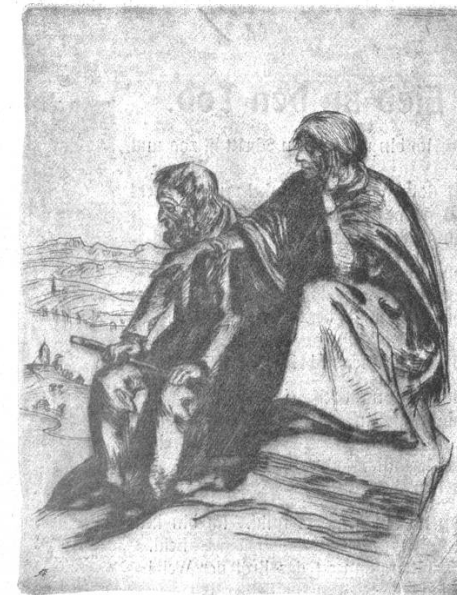
Die Alten. Radierung von Albert Welti.

Bei solcher Veranlagung ist es nicht verwunderlich, daß Welti bei Lebzeiten vom Kuntpublikum wenig behelligt wurde. Wohl hatte er Freunde, die seinen Wert erkannten oder ahnten, wohl gab es manchen, der an seinen Radierungen und etwa an einigen seiner in öffentlichen Gemäldesammlungen der Schweiz verstreuten und daher kaum beachteten Bildern seine herzlichste Freude hatte, aber der Menge blieb er unbekannt.