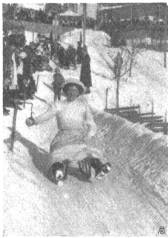
Ringstechen im Wetschlitteln

von frühmorgens an die Fenster sperrangelweit offenzuhalten. Gegenüber ist das Schlachthaus, dessen Gequiech selbst das der Knaben in den Pausen übertönt und sie an den Anblick grausamer Martern gewöhnt. Dem Unterricht selber aber ist äußerst hinderlich das Geräusch der Fuhrwerke auf dem holperigen Pflaster des Rathhausplatzes, auf den die Fenster der meisten Schulzimmer hinaus schauen, besonders an Marktagen. Einigen dieser Uebelstände, welche jedenfalls nicht allen unter ihnen unbekannt sind, hätte abgeholfen werden können, wenn man