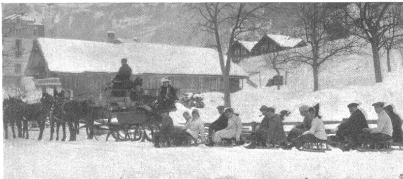
Schlittenpartie in Grindelwald.

sich eine dunkle, großäugige und schlanke Italienerin aus, ein wenig zerzaust und nicht sehr sauber gekleidet. Aber unter den jungen Fabrikmädchen, die er täglich an der Werkstatt vorübergehen sah und von denen manche ihm recht hübsch erschienen waren, konnte er sich diese Maria Testolini nicht denken.