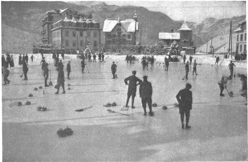
Curling-Spiel in Grindelwald.

Leider ist auch der Wintersport auf dem besten Wege, Selbstzweck zu werden. Fast alle Veranstaltungen dieser Art, die Spiele, das Fahren und Rennen auf dem Schnee und Eis, lassen keinen Zweifel darüber aufkommen. Die