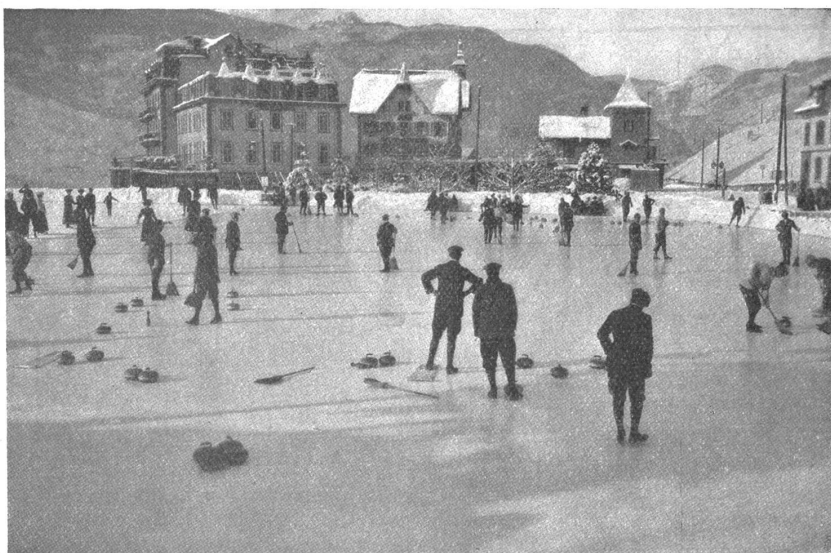
Curling-Spiel in Grindelwald.

Leider ist auch der Wintersport auf dem besten Wege, Selbstzweck zu werden. Fast alle Veranstaltungen dieser Art, die Spiele, das Fahren und Rennen auf dem Schnee und Eis, lassen keinen Zweifel darüber aufkommen. Die