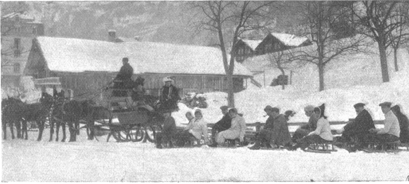
Schlittenpartie in Grindelwald.

sich eine dunkle, großäugige und schlank Italienerin aus, ein wenig zerzaust und nicht sehr sauber gekleidet. Aber unter den jungen Fabrikmädchen, die er täglich an der Werkstatt vorübergehen sah und von denen manche ihm recht hübsch erschienen waren, konnte er sich diese Maria Testolini nicht denken.