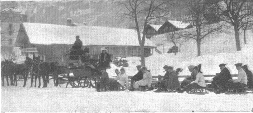
Schlittenpartie in Grindelwald.

sich eine dunkle, großäugige und schlank Italienerin aus, ein wenig zerzaust und nicht sehr sauber gekleidet. Aber unter den jungen Fabrikmädchen, die er täglich an der Werkstatt vorübergehen sah und von denen manche ihm recht hübsch erschienen waren, konnte er sich diese Maria Testolini nicht denken.