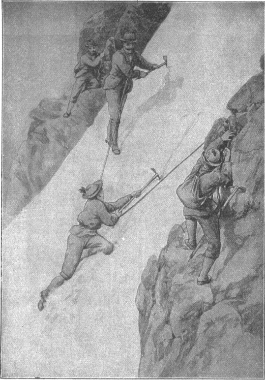
Überschreiten einer Schneerinne. (Sranccé).

Um sechs Uhr abends standen wir auf dem Schnee des nach Zermatt hinunterführenden Grates und hatten alle