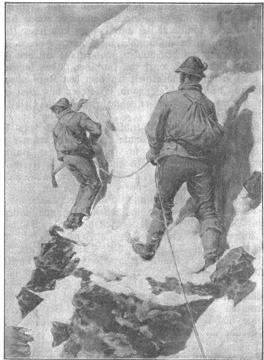
Bergsteiger an der Schneewand. (Sranccé).

Die Gerichtsverhandlung ergab nichts positives; die Rechtfertigung Whympers wurde angenommen und Taug-