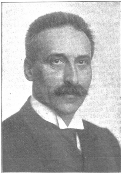
Dr. von Planta, Nationalratspräsident.

Die erste Woche der Bundesversammlung war eine Woche ernster Arbeit und es gereicht dem Schweizer Volk zur Genugtuung, fest-