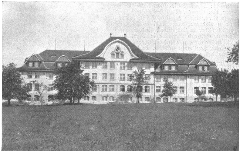
Die Land- und Hauswirtschaftliche Schule Schwand-Münsingen. Die Hauptfassade.

Die neue Bildungsstätte wird den jungen Leuten, die