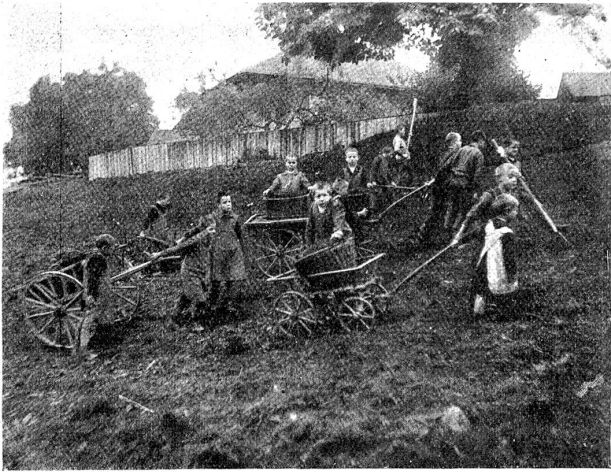
Blinde Knaben mit Feldarbeiten beschäftigt.

noch verhältnismäßig jüngern Datums. Die Geschichte nennt als erste europäische Blindenanstalt diejenige im Jahre 1784 in Paris errichtete, welche sich vorzüglich bewährt und rasche Nachahmung gefunden haben soll. In Bern wurde um das Jahr 1831 eine Privatblindenanstalt durch den erblindeten alt Großweibel G. E. von Morlot gegründet. Das Vorbild