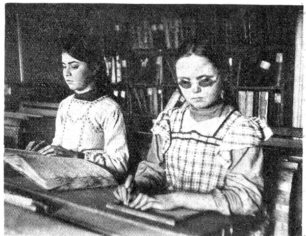
Blinde Mädchen beim Unterricht.

Um den Blinden Lesen und Schreiben beizubringen, hatten sich bis vor wenigen Jahren eine Unmenge verschiedenartigster erhobener Schriftzeichen-Systeme gegenseitig das Feld streitig gemacht. Zur Zeit wird dem vom Franzosen Louis Braille (1809—1852) erfundenen Punktschriftsystem, sowohl von den Blinden als den Blindenpädagogen aller Länder der Vorrang eingeräumt. In diesem werden das Alphabet und die Zahlen aus nur sechs Punkten, die natürlich für jeden Buchstaben und jede Zahl verschieden eigenartig gruppiert