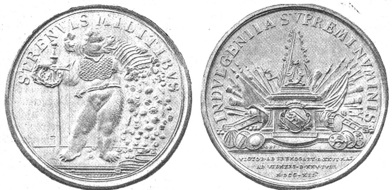
Die an die Offiziere des siegreichen Heeres verteilte Medaille.

Einzig Nidwalden hatte rundweg die Ablehnung des Vertrages erklärt, Zug schwankte — da setzte namentlich in Schwyz und Zug die Wühlarbeit der Kapuziner ein, die den Religionskrieg erklärten und es wirklich dazu brachten, daß am 19. Juli 4000 Schwyzer, Unterwaldner und Zuger nachts bei Gislikon über Luzernergebiet zogen, die bernische Abtheilung an der Sinerbrücke andern Tags angriffen und mit einem Verlust von ungefähr 100 Toten verjagten. Auf dieses Signal hin flammte der Kriegseifer auch in Luzern wiederum auf, wo der Landsturm erging und unter den Augen der Regierung die Kanonen aus dem Zeughaus geholt wurden; ja, der Amtschultheiß Schwyzer selber stellte sich an die Spitze der ungefähr 4000 Mann, die jetzt aufbrachen. Trotz des schlechten Wetters vereinigte sich die katholische Macht am 22. vor Wohlten, aus dessen Mauern am Tag vorher das Bernerheer sich nach Villmergen zurückgezogen hatte. Nachdem heftige Regengüsse zweimal den geplanten Angriff auf die Keyser verunmöglicht hatten, kam es endlich am 25. Juli 1712 hinter