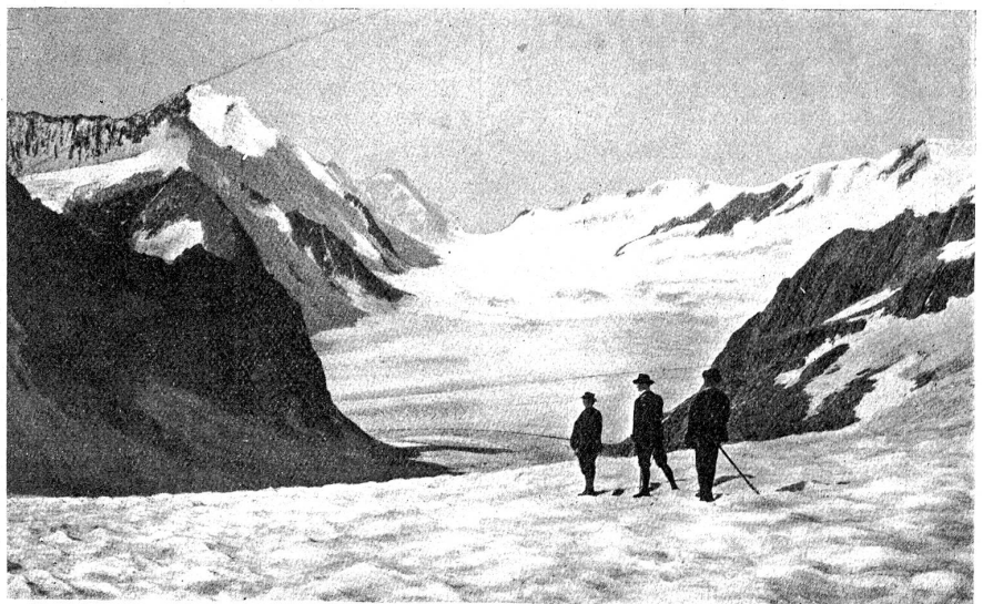
Das Aletschhorn von der Grünhornlücke aus.