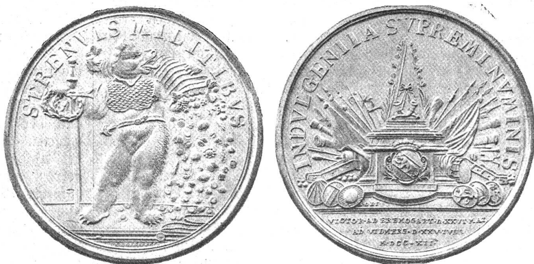
Die an die Offiziere des siegreichen Heeres verteilte Medaille.

Einzig Nidwalden hatte rundweg die Ablehnung des Vertrages erklärt, Zug schwankte — da setzte namentlich in Schwyz und Zug die Wühlarbeit der Kapuziner ein, die den Religionskrieg erklärten und es wirklich dazu brachten, daß am 19. Juli 4000 Schwyzer, Unterwaldner und Zuger nachts bei Gislifon über Luzernergebiet zogen, die bernische Abteilung an der Sinnerbrücke andern Tags angriffen und mit einem Verlust von ungefähr 100 Toten verjagten. Auf dieses Signal hin flammte der Kriegseifer auch in Luzern wiederum auf, wo der Landsturm erging und unter den Augen der Regierung die Kanonen aus dem Zeughaus geholt wurden; ja, der Amtschultheiß Schwyzer selber stellte sich an die Spitze der ungefähr 4000 Mann, die jetzt aufbrachen. Trotz des schlechten Wetters vereinigte sich die katholische Macht am 22. vor Wohlen, aus dessen Mauern am Tag vorher das Bernerheer sich nach Villmergen zurückgezogen hatte. Nachdem heftige Regengüsse zweimal den geplanten Angriff auf die Reker verunmöglicht hatten, kam es endlich am 25. Juli 1712 hinter