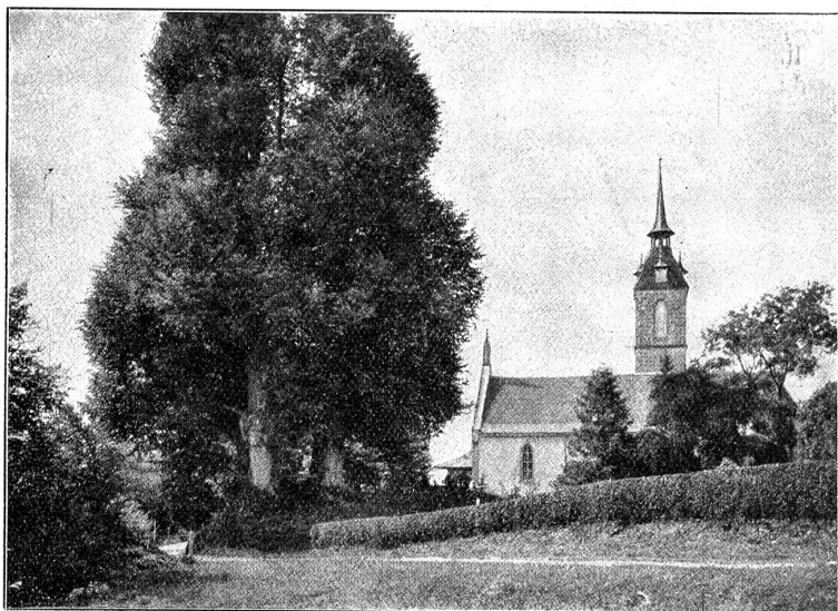
Die vier Linden in Kirchberg, im Jahr 1712 vom dortigen Pfarrer Johann Anton Franck zum Andenken an den Sieg von Villmergen gepflanzt.

auf 35,000 Mann anwuchs; davon waren für die eigentlichen Operationen aber keine 15,000 Mann verfügbar, der Rest verteilte sich auf acht verschiedene Truppenkörper zum Grenzschutz im Oberaargau, Emmental, Oberhasli, Oberland, Waadtland, Mittelland und in der Hauptstadt, während bis zum Schluß 1000 Mann im St. Gallischen blieben. Am 25. April 1712 überschritten 1400 bernische „Füsiliere“ die Aare bei Stilli unter dem Schutz von 12 Kanonen und zogen vereint mit 2000 Zürchern ins Gebiet des Abts von St. Gallen, das sie bald genug eroberten, in dessen Kloster sie 400 Saum Wein und eine „wohlaffortierte Bibliothek“, aber leider weder Geld noch Silbergeschirr fanden.